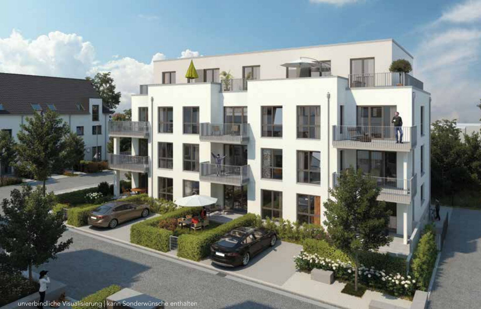
unverbindliche Visualisierung | kann Sonderwünsche enthalten