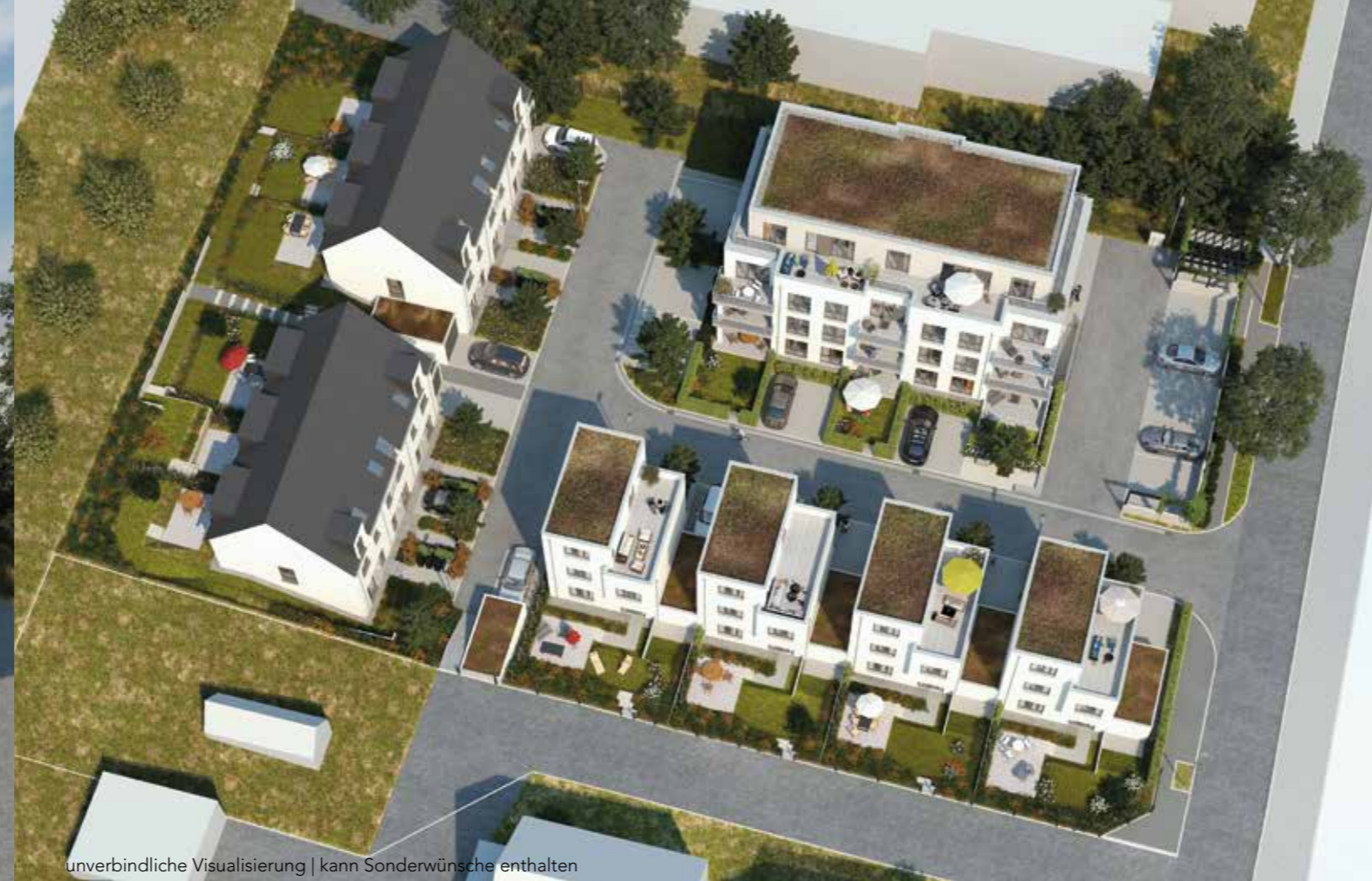
unverbindliche Visualisierung | kann Sonderwünsche enthalten